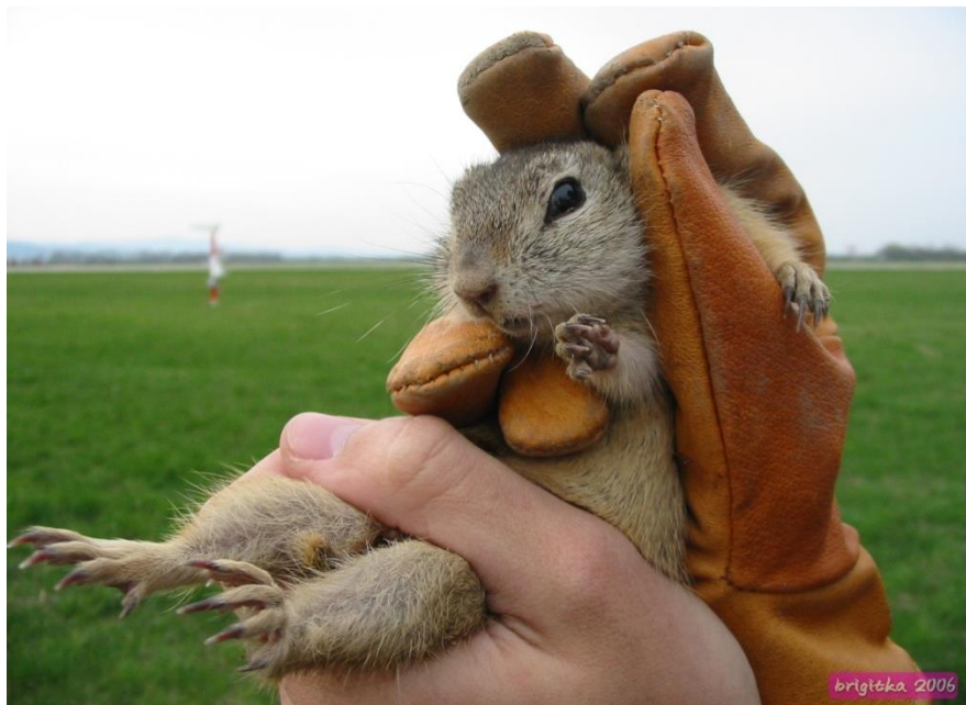
Odchyt sysľa pasienkového na letisku M.R.Štefánika v Bratislave (Bridišová,2006)