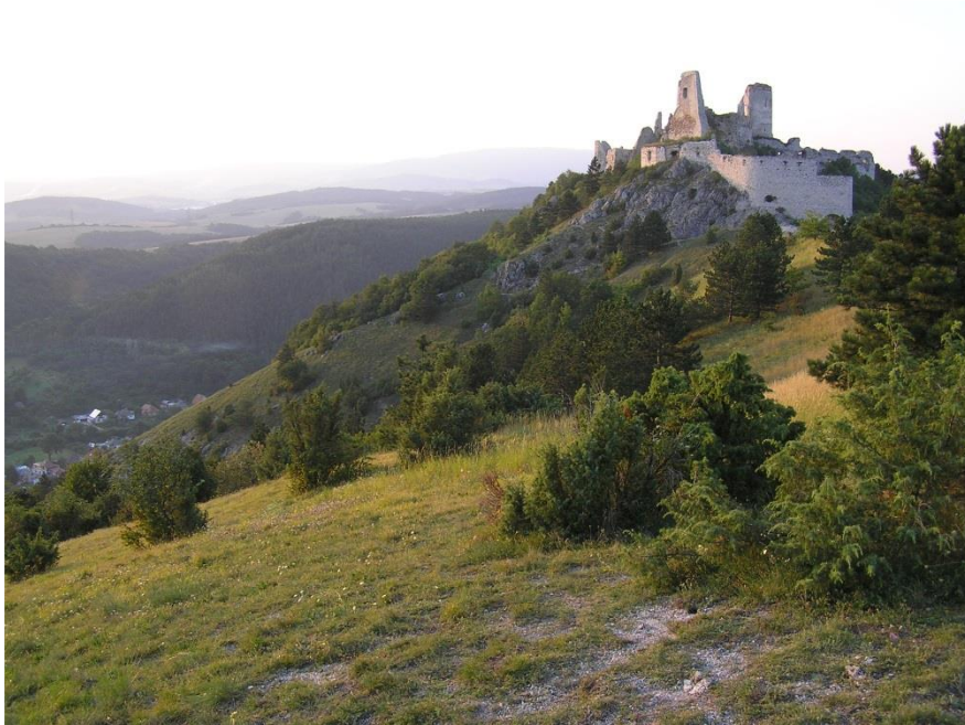
NPR Čachtický hradný vrch (Petluš, 2009)