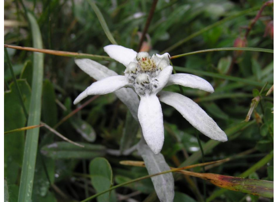
Plesnivec alpský Leontopodium alpinum (Petluš, 2007)