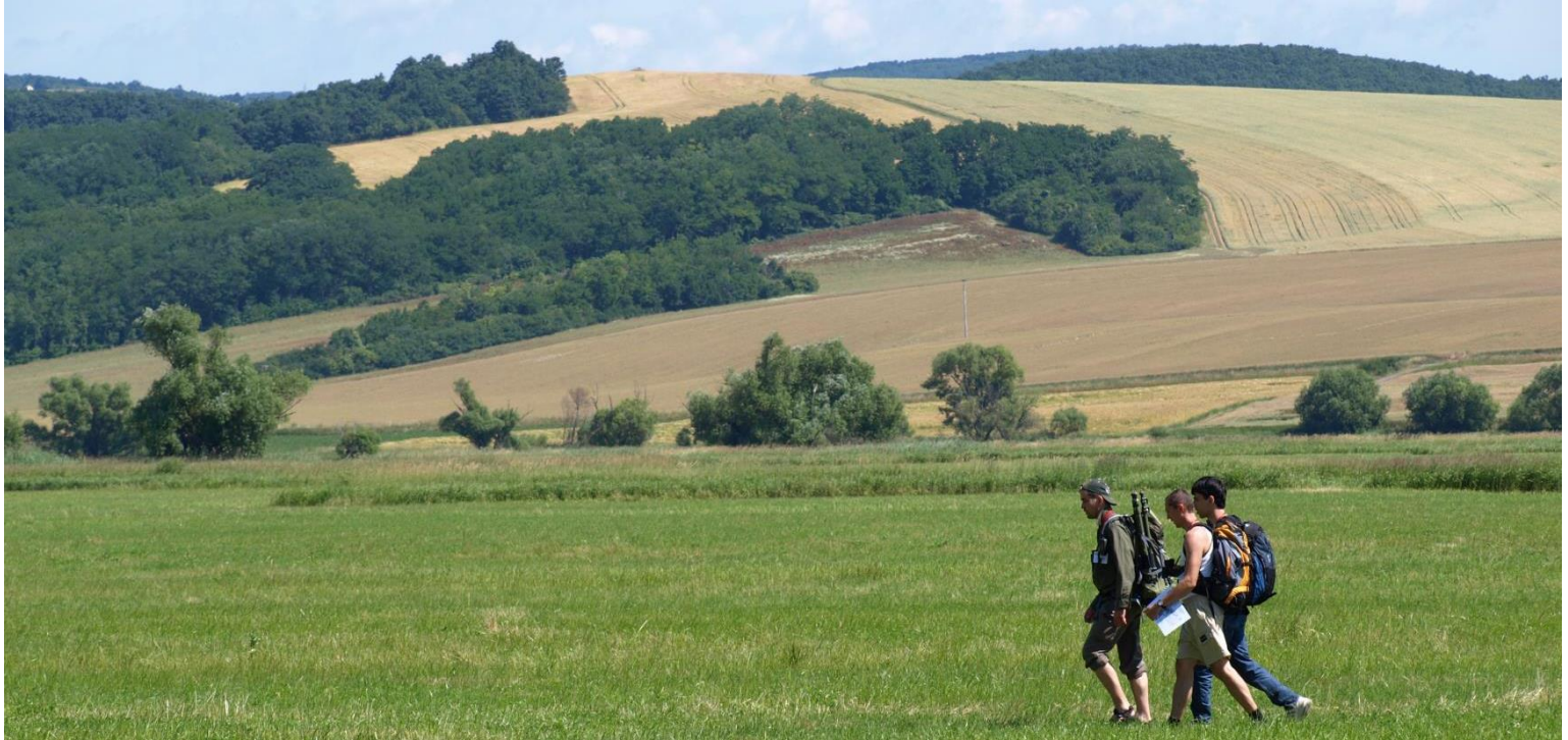
Krajina ramsarskej lokality Poiplie (Petluš,2008)