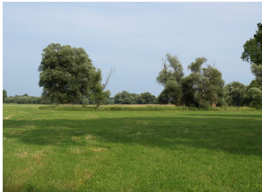
Trvalé trávne porasty Ramsarskej lokality Poiplie (Petluš,2008)