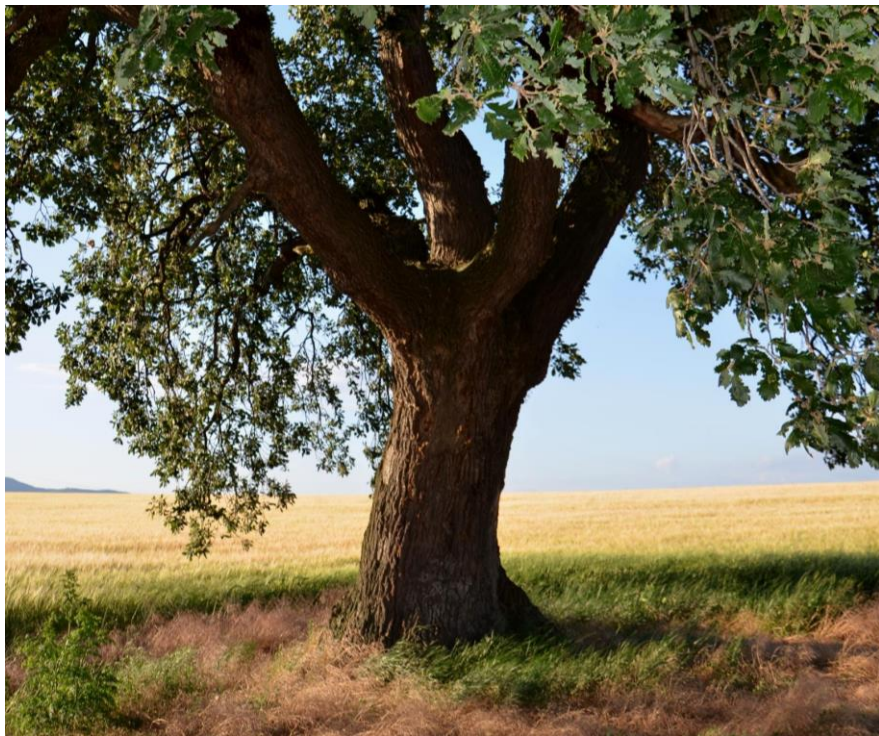
Dub plstnatý Quercus pubescens v Žitavské pahorkatíně (Petluš, 2011)