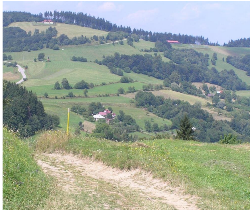
CHKO Bílé Karpaty (Petluš, 2009)