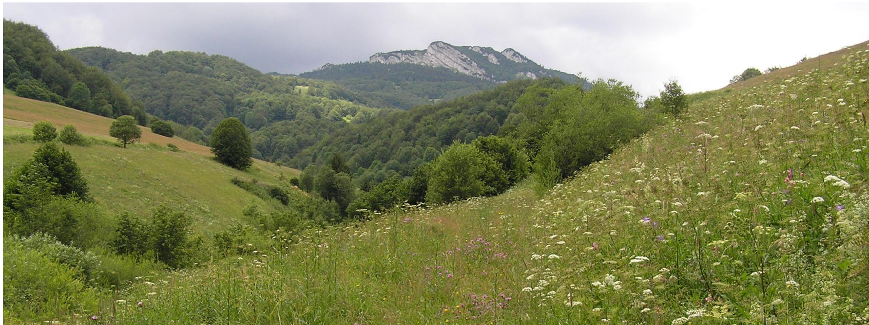
NPR Čierny kameň, NP Veľká Fatra (Petluš, 2008)