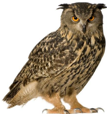
Všetky dravce a sovy